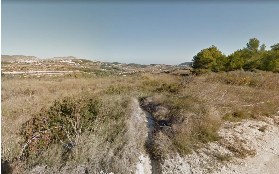
Ilustración 5: Paisaje General observado desde la Planta Solar Fotovoltaica proyectada