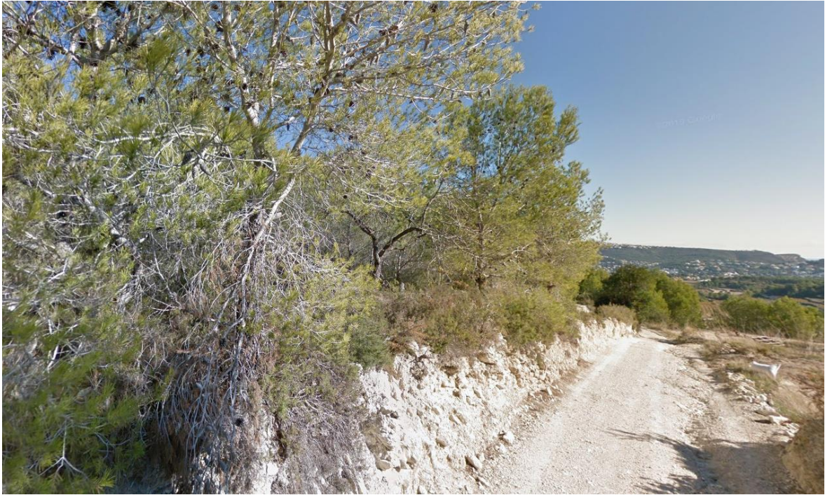
Ilustración 9: Paisaje General observado desde la Planta Solar Fotovoltaica proyectada.