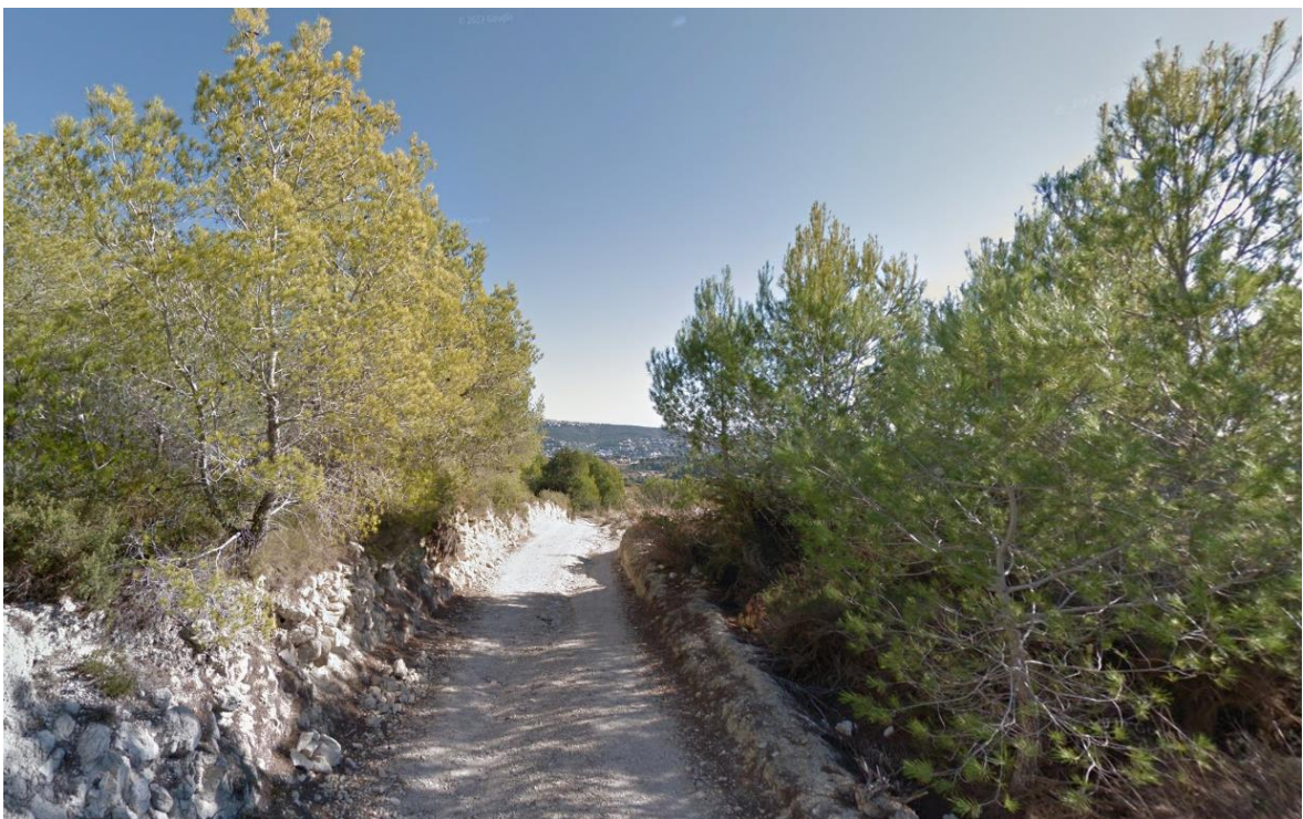
Ilustración 8: Paisaje General observado desde la Planta Solar Fotovoltaica proyectada.