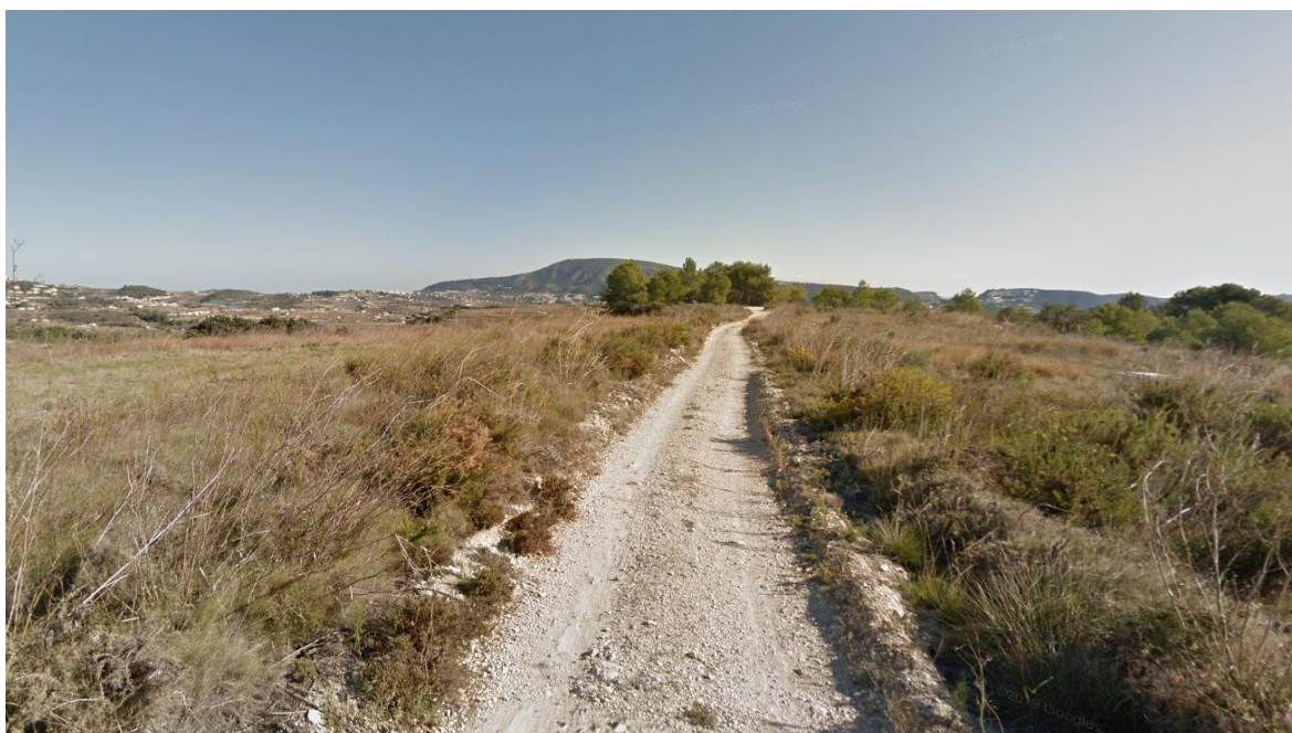
Ilustración 3: Paisaje General observado desde la Planta Solar Fotovoltaica proyectada.