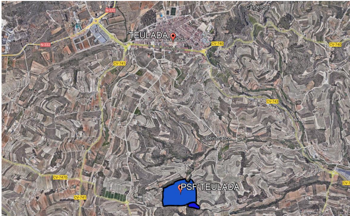
Ilustración 1: Ubicación de la Planta Solar Fotovoltaica.