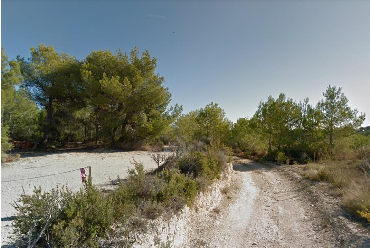
Ilustración 7: Paisaje General observado desde la Planta Solar Fotovoltaica proyectada.