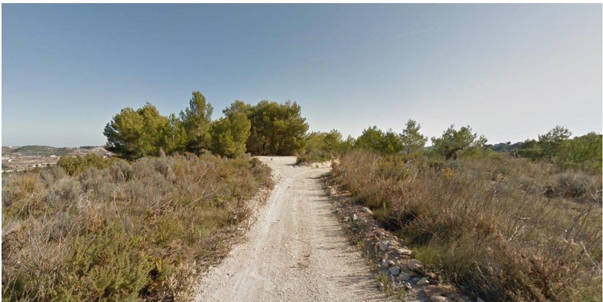
Ilustración 6: Paisaje General observado desde la Planta Solar Fotovoltaica proyectada.